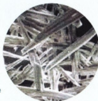
aragonite non incrostante